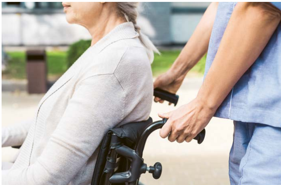
Alters- und Pflegeheime zählen zu den Fokusbranchen 2025.

Die Arbeitswelt verändert sich stetig – und damit das Risiko, dass orts- und branchenübliche Löhne unterboten werden. Genau hier setzt die Arbeitsmarktbeobachtung der Tripartiten Kommission (TPK) des Kantons St.Gallen an. Als Teil der flankierenden Massnahmen zum freien Personenverkehr legt sie jährlich Fokusbranchen fest, die verstärkt kontrolliert werden.