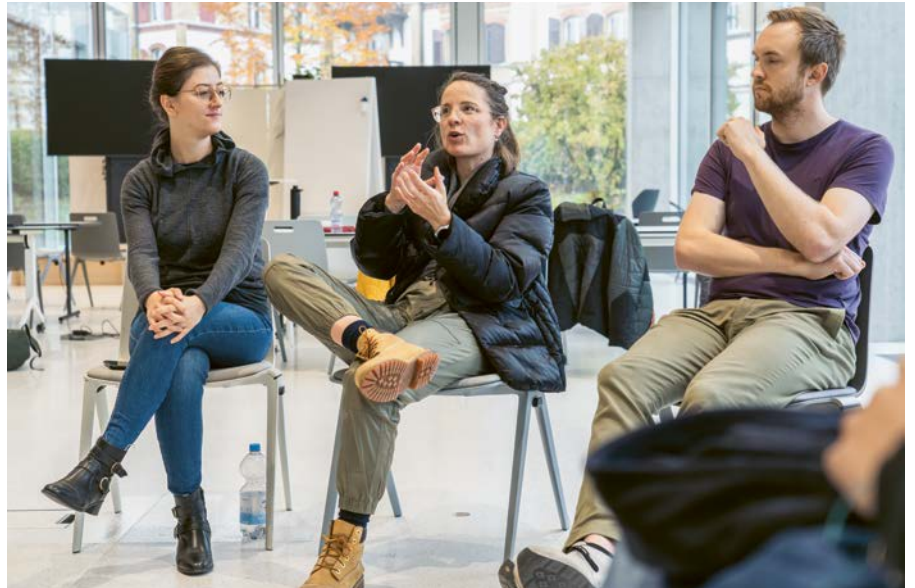
Teilnehmerinnen und Teilnehmer des 1. HSG START Accelerator-Programms.

Mit dem HSG START Accelerator will der Kanton St.Gallen die Attraktivität für Startups und seine Innovationskraft erhöhen. Die erste Durchführung hat im September 2025 gestartet. Die Startups im Förderprogramm arbeiten an der Schärfung ihrer Geschäftsmodelle, testen Markteintrittsstrategien und bereiten sich auf Investorengespräche vor.