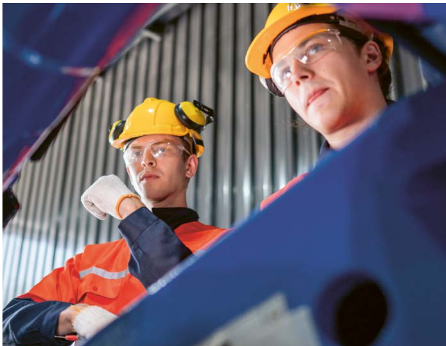
Grenzgänger prägen die Arbeitswelt im Rheintal massgeblich mit.

Grenzgängerinnen und Grenzgänger sind insbesondere für das St.Galler Rheintal und die dort ansässige Industrie unverzichtbare Arbeitskräfte. Die Region zeigt exemplarisch, wie grenzüberschreitende Arbeit funktionieren kann – wirtschaftlich effizient, kulturell integriert und administrativ zunehmend digitalisiert.