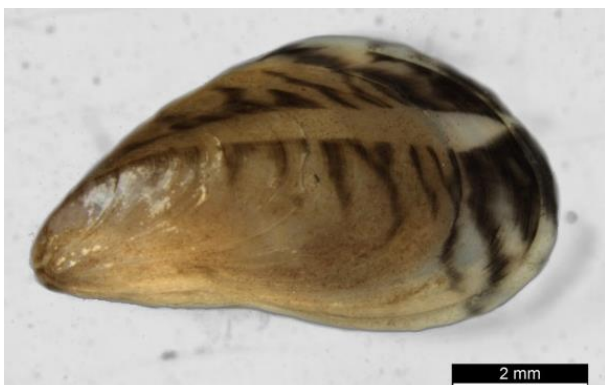
Abb. 1: Quagga-Muschel.

Sie kann eine Größe von bis zu 40 mm erreichen und wird etwa drei bis fünf Jahre alt. Das Alter eines Individuums lässt sich mithilfe von Altersringen bestimmen. Anhand der Größe ist dies nicht zuverlässig möglich. Das größte Wachstum wird im Frühjahr erreicht und ist abhängig von der Wassertemperatur, der Nahrungsverfügbarkeit, den Sauerstoffverhältnissen und der Strömung.