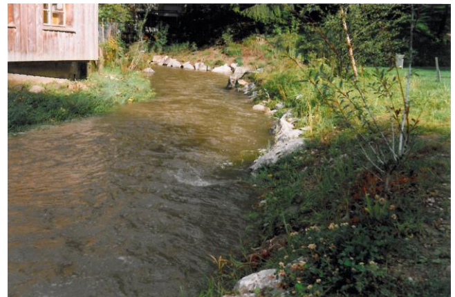
ca. 3 Jahre nach Bauausführung