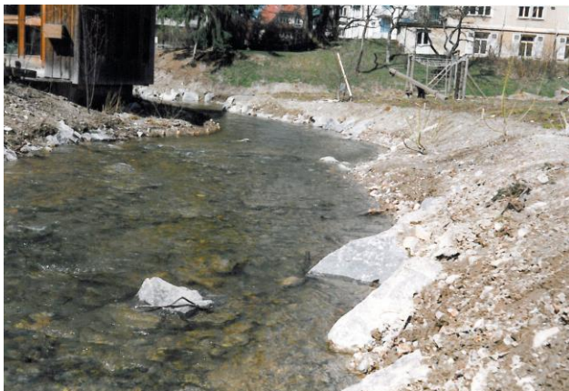
unmittelbar nach Bauausführung