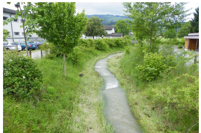
ca. 5 Jahre nach Bauausführung