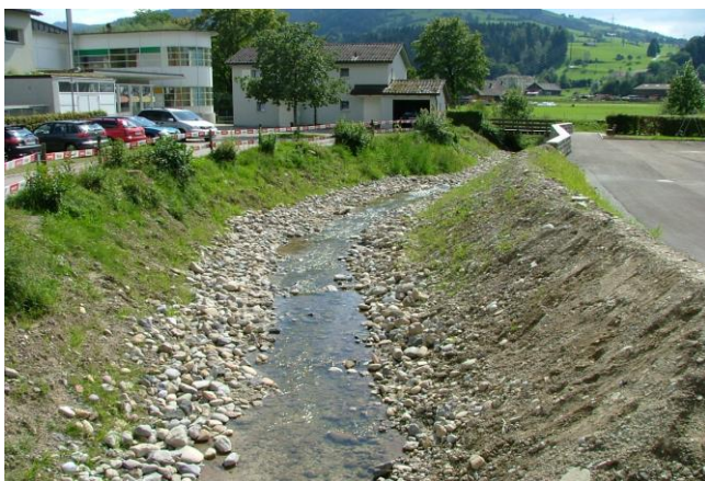
unmittelbar nach Bauausführung