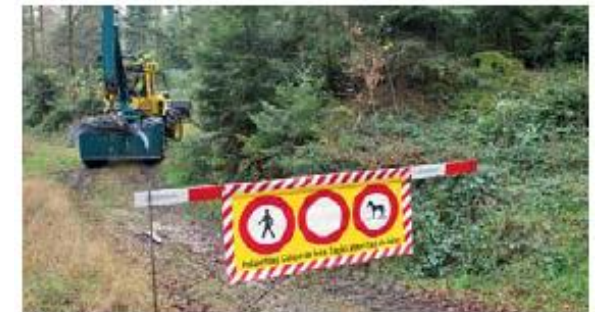
3 Zur Absperrung von Wald-, Feld- und Fusswegen dürfen Absperrplanen eingesetzt werden. Sie werden mit rot-weiss gestreiften Abschränkungen (z.B. Latten) befestigt.

Kenne deine eigenen Grenzen! Für welche Situationen brauche ich Unterstützung?