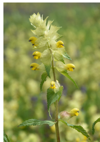
Klappertopf in Vollblüte