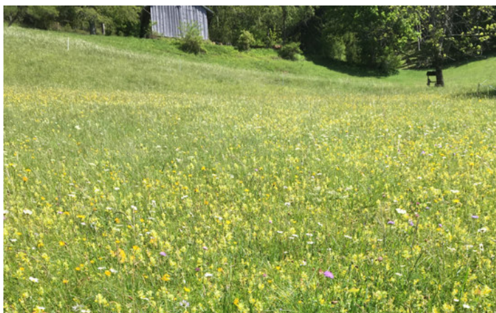
Artenreiche Wiese mit hohem Klappertopfanteil

Klappertopfarten ( Rhinanthus alectorolophus und Rhinanthus minor ) sind einheimische Pflanzen, welche hauptsächlich auf extensiv genutzten Wiesen und Weiden vorkommen. Sie sind etwa 10–50 cm hoch und dicht behaart ( R. alectorolophus ) oder kahl ( R. minor ). Die gelbe Blüte ist 2-lippig und weist einen über 2 mm langen, violetten oder weisslichen Zahn auf. Der Klappertopf blüht ab Mitte Mai. Der Klappertopf ist in grünem Zustand leicht giftig, wobei das Gift durch die Trocknung des Schnittguts unschädlich wird.