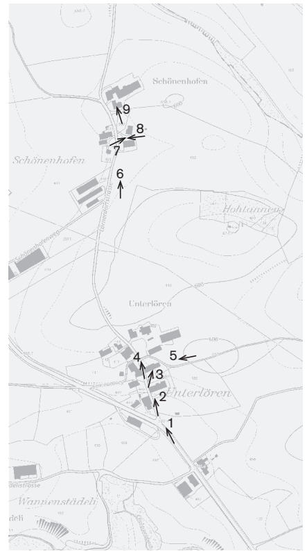
Plangrundlage: Übersichtsplan des Kantons St. Gallen UP5, © Benützung der Daten der amtlichen Vermessung durch die kantonale Vermessungsaufsicht bewilligt, 18. September 2012 Fotostandorte 1:10 000 Aufnahmen 2011: 1-9