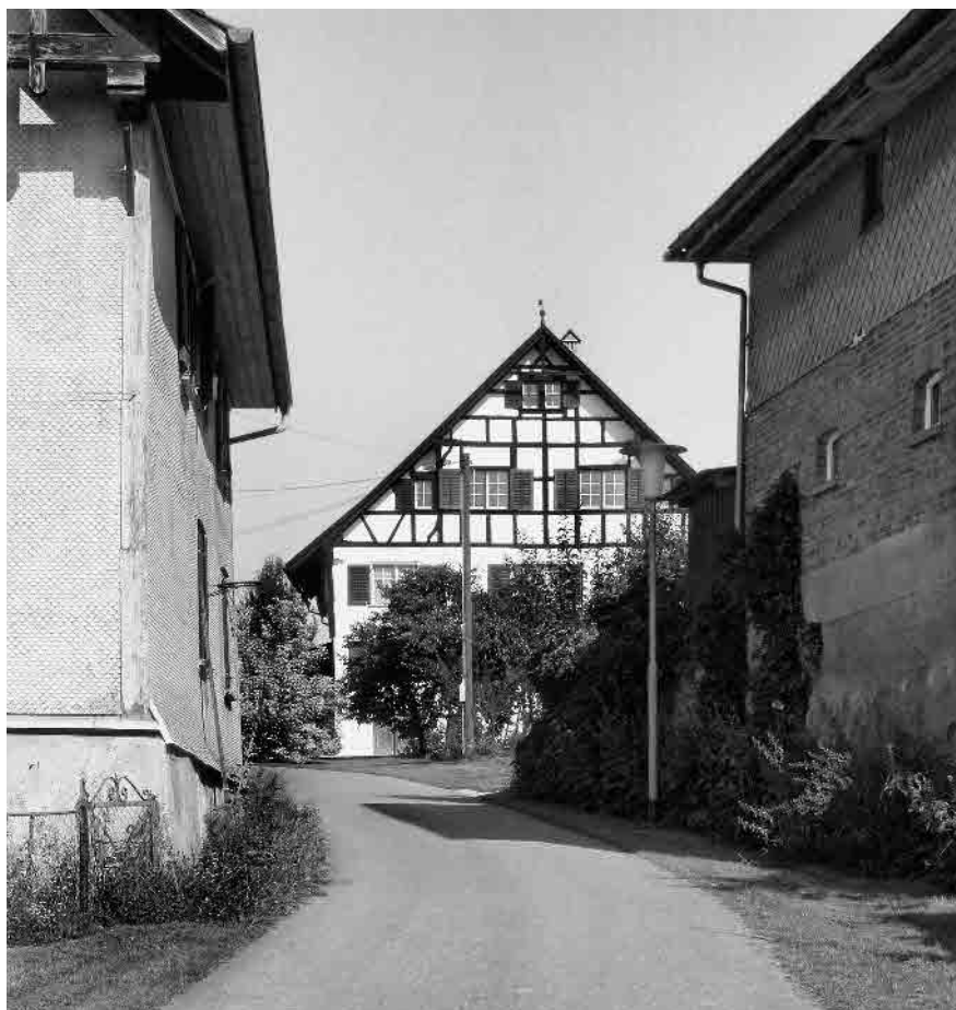
4 Haus Wehrle, wohl 1648