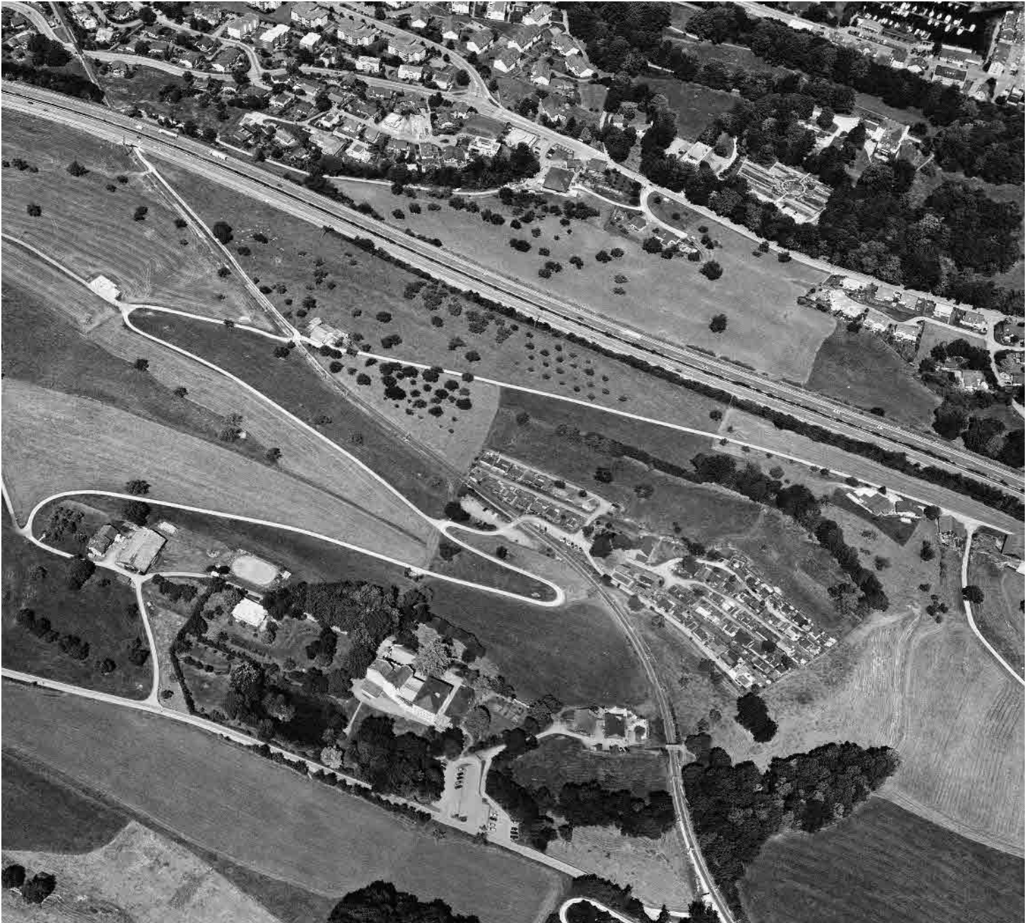
Flugbild Bruno Pellandini 2008, © BAK, Bern

Die drei Schlossgruppen Wiggen, Wartegg und Wartensee mit gegenseitigem Sichtbezug auf Hangterrassen am Rorschacherberg. Subtiler Zusammenhang von imposantem Einzelbau und umgebender Parkanlage innerhalb der Ensembles.