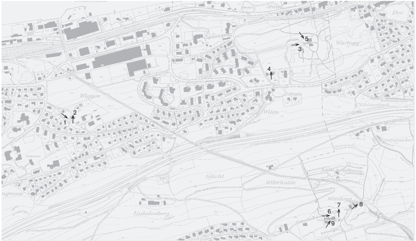
Plangrundlage: Übersichtsplan des Kantons St. Gallen UP5, © Benützung der Daten der amtlichen Vermessung durch die kantonale Vermessungs- aufsicht bewilligt, 18. September 2012 Fotostandorte 1:10 000 Aufnahmen 2011: 1–9