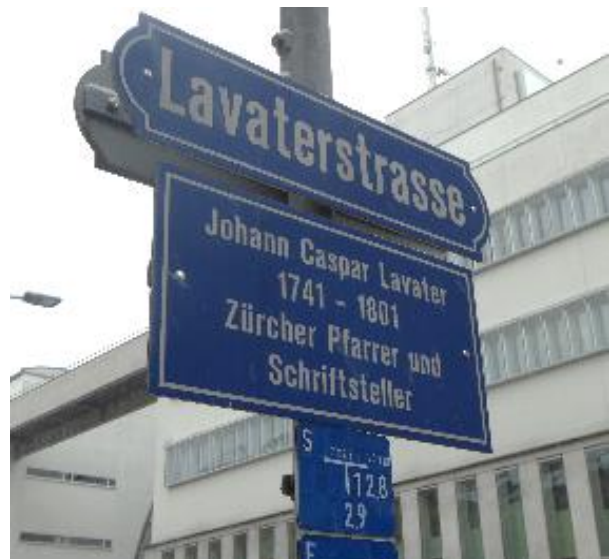
Erinnerung an den Pionier und Popularisierer der Physiognomik des 18. Jahrhunderts.

An den berühmtesten Vertreter der sogenannten Physiognomik erinnern in der Schweiz verschiedene öffentliche Orte. Das Geburtshaus an der Spiegelgasse 11 in der Zürcher Altstadt, wo er 37 Jahre wohnte, das Lavaterhaus an der Peter-Hofstatt 6, wo er 17 Jahre wohnte, die nach ihm benannte städtische Schule Lavater in Zürich-Enge, die Lavaterstrasse in der Nähe des «Lavatergüetli» in Zürich-Enge und die Lavaterstrasse in St.Gallen, zwischen Vadianstrasse und St.Leonhardstrasse. Wie ausgerechnet unsere Stadt zu einer Lavaterstrasse kommt, ist bisher nicht erforscht. An der Strasse gibt es keine einzige Hausnummer, d.h. niemand hat die Lavaterstrasse als Adresse. Lavater hat die Physiognomik nicht erfunden. Schon in der Antike finden sich Versuche, über das Äussere eines Menschen Vermutungen über dessen Innenleben anzustellen. Lavater machte daraus eine «wissenschaftliche» Methode – und ein Gesellschaftsspiel. Er versuchte, mittels eines Bildarchivs zu zeigen, wie man anhand von Gesichtszügen, Schädelproportionen und Körperformen den menschlichen Charakter erkennen könne. Lavater war zudem der erste, der die Gesichtswinkel-Theorie des holländischen Mediziners Camper öffentlich machte. Diese Theorie behauptete, man könne mit mathematischer Genauigkeit die Nähe der «menschlichen Rassen» zum Tierischen bestimmen. Je spitzer der Winkel, desto tierischer oder affenähnlicher, je näher am rechten Winkel (dem griechisch-antiken Ideal), desto zivilisierter.