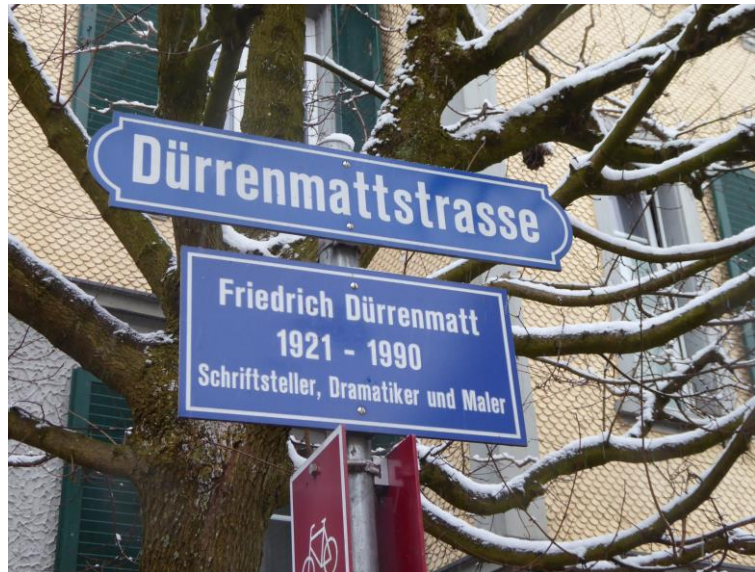
Die Krügerstrasse (Vonwilstrasse bis Burgstrasse): Im Jahr 1904 benannt und im Jahr 2009 in Dürrenmattstrasse umbenannt.