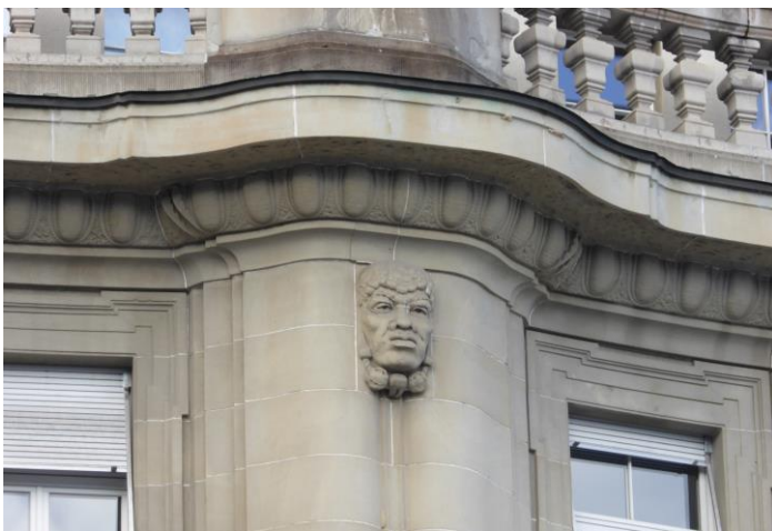
Der Kontinent Afrika an einem Pfeiler der Südost-Fassade des Haupt- und SBB-Bahnhofs St.Gallen.

Eine Gesellschaft, die ihre Weltläufigkeit und ihr Weltwissen betonen will, stellt gerne an ihren repräsentativen Bauten die Kontinente dar. Nach dem Weltbild des Mittelalters mit Europa, Asien und Afrika waren es nach der «Entdeckung» Amerikas die vier Kontinente, die sich z.B. am Haus zum Pelikan (Schmiedgasse 15) finden. Diese liessen sich im Rahmen der sich entwickelnde Rassentheorien mit den vier konstruierten Hautfarben «Weiss», «Gelb», «Schwarz» und «Rot» in Einklang bringen. Als mit der «Entdeckung» Australiens ein fünfter Kontinent dazukam, wurde schliesslich