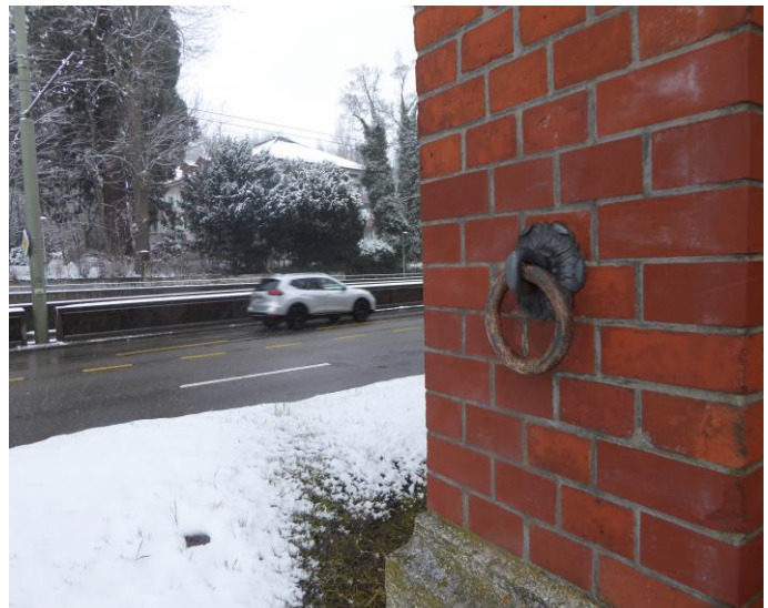
Blick von der Nordwest-Ecke der Reithalle über die Autobahneinfahrt hinweg auf das ehemalige Gelände der Villa «Zum Röteli».