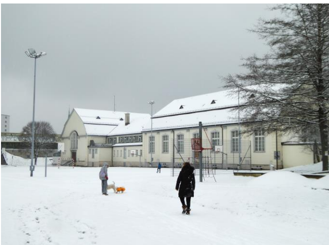
Blick auf die alte Kreuzbleiche-Turnhalle, wo im Jahr 1944 jüdische Häftlinge aus Bergen-Belsen untergebracht waren.

Südspitze der Kreuzbleiche, Vonwilstrasse 26