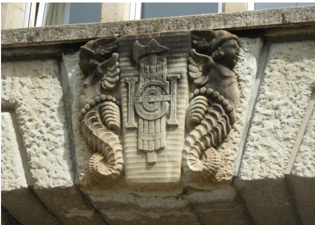
Besonderer Götterbote mit doppelten Flügeln und einem Fischkörper.

Den Götterboten Hermes (Griechenland) bzw. Merkur oder Mercurius (Rom), den Gott des Verkehrs, der Reisenden und der Kaufleute erkennt man jeweils am geflügelten Helm und meist dazu noch am sogenannten geflügelten Merkurstab, an dem sich zwei Schlangen emporwinden. Die Kaufmannsstadt St.Gallen scheint eine besondere Beziehung zu diesem göttlichen Wesen zu haben. Es finden sich in der Stadt (abgesehen von Merkurstrasse und Merkatorium) nicht weniger als 30 Darstellungen von Hermes/Merkur im öffentlichen Raum (Bilder, Reliefs, Statuen und Tafeln).