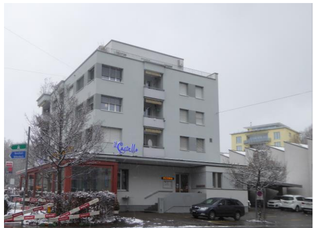
Früherer Standort der Konzerthalle Hotel St.Leonhard mit Sitzplätzen für 800 Personen.

Die im Jahr 1966 abgebrannte Konzerthalle Hotel St.Leonhard an der Ecke Bogenstrasse/Burgstrasse präsentierte seine «freundlichen Lokalitäten für kleinere und grössere Gesellschaften» und einen an München erinnernden «Konzertgarten» an. Der Ort war nicht nur bei den Soldaten der nahegelegenen Kaserne beliebt, auch die Zivilgesellschaft traf sich hier zu sozialen Anlässen, nach dem Sonntagsspaziergang zu Kaffee und Kuchen sowie für das Feierabendbier. Das «St.Leonhard» war zudem weiterhin bekannt für seine Konzerte und Bälle. Und für seine Völkerschauen.