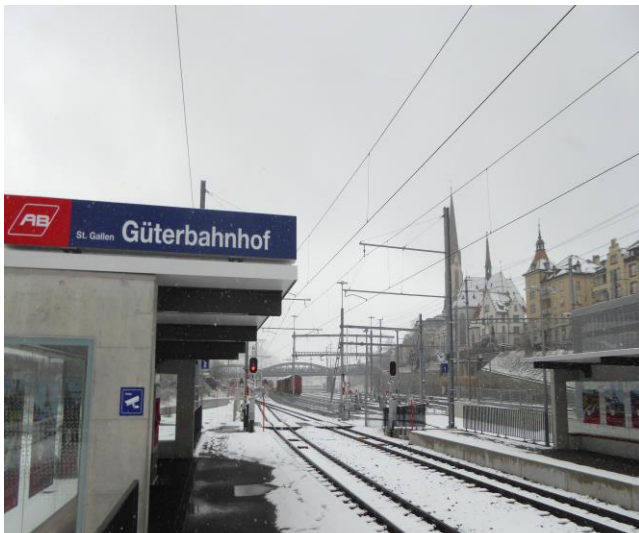
Blick gegen Westen auf die Linien der Appenzeller Bahnen, der Schweizerischen Südostbahn und der SBB. Rechts der Otmarbrücke die Pfarrkirche St.Otmar.

Die Beziehungen zwischen Sklaverei und Eisenbahn sind zahlreich und eng. Was die Anfänge im Pionierland England betrifft, so muss man darauf hinweisen, dass die Innovation der Dampfmaschine eng mit Sklavereiprofiten verknüpft war. Der Vater von James Watt war Kaufmann sowie Sklavenhändler, und auch James Watt selbst profitierte von diesem Geschäft. Im Jahr 1825 fuhr die erste Dampfeisenbahn der Welt auf der Linie Stockton-Darlington. Ein beträchtlicher Teil des Geldes, das britische Sklavenshalterinnen und Sklavenshalter im Jahr 1833 bei der Abschaffung der Sklaverei erhielten, wurde später in Eisenbahnprojekte reinvestiert. Schon im Jahr 1837 (zehn Jahre vor dem Beginn