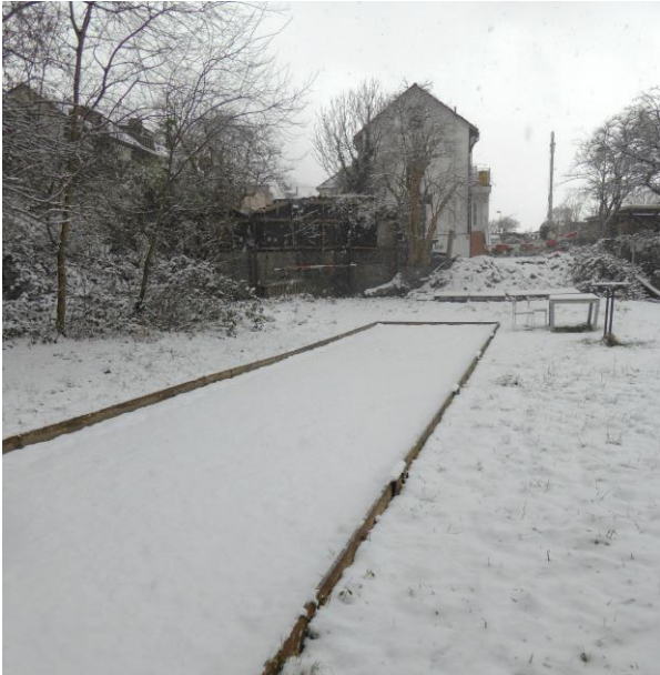
Archäologie migrantischer Kultur: Bocciabahn zwischen Güterbahnhofstrasse und Zimmerstrasse.

Zwischen den Stationen 2 und 3 durchqueren wir ein migrantisch geprägtes Quartier. Menschen mit kleinem Einkommen wohnen in günstigen Wohnungen mit viel Lärm (Oberstrasse, Eisenbahn) und es entstehen immer wieder wechselnde ethnisch geprägte oder internationale Ladenlokale, Treffpunkte und Restaurants («Club Freedom», «Club Çegrani», «Club International», «Thai-Mandarin-Edelweiss», «Istanbul»). Die Quartiere Lachen / Vonwil weisen einen hohen Ausländerinnen- und Ausländeranteil aus. Am höchsten für St.Gallen ist dieser aktuell mit 39,3 Prozent im Lachenquartier (wo ich aufgewachsen bin und bis ins Jahr 1978 gewohnt habe) und am tiefsten mit 16,3 Prozent in St.Georgen (wo ich seit dem Jahr 2013 wohne).