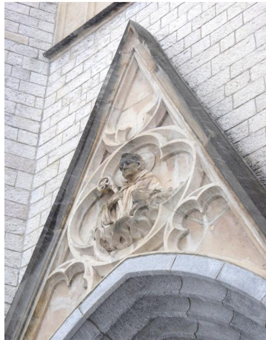
Darstellung des Abtes Otmar von St.Gallen (etwa 689 bis 759) mit Krummstab an der gleichnamigen Pfarrkirche (fertiggestellt im Jahr 1908).

Aber da Kolonialismus und Sklaverei mit den beiden katholischen Grossmächten Portugal und Spanien begonnen hat, drängt sich doch die Frage auf: Was ist die Position der heutigen katholischen Kirche zur Sklaverei und v.a. zur Wiedergutmachung dieses Verbrechens gegen die Menschlichkeit? Zur Beantwortung dieser Frage wandte ich mich vor einigen Jahren zuerst an das Bistum St.Gallen. Das Sekretariat des Bischofs verwies mich in dieser Sache an «Justitia et Pax», eine Laienkommission der Katholischen Kirche, die sich u.a. gesellschaftlichen und politischen Fragen befasst. Dort hiess es, ich solle mich an die schweizerische Bischofskonferenz wenden, wo man mir riet, «Justitia et Pax» zu kontaktieren.