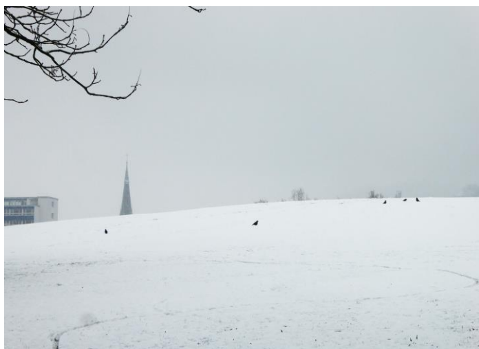
Im Umfeld von Kaserne und Kampfbahn vom Volksmund getauft. der «Bayonetthügel» als höchster Punkt der Kreuzbleiche.

In St.Gallen (Webersbleiche, Bleicheli, Kreuzbleiche) und anderen Städten zeugen Orts- und Flurnamen von der Bedeutung einer Arbeitsphase der spätmittelalterlichen und frühneuzeitlichen Textilindustrie sowie des Bleichens. Leinen-, Hanf- und Baumwollfasern wurden im naturfarbigen Zustand versponnen und verwebt, was in einer Gelblich- bis Graubraunfärbung der fertigen Gewebe resultierte. Auf dem Bleichplatz wurden die Gewebe noch nass ausgelegt, kontinuierlich feucht gehalten und dem Sonnenlicht ausgesetzt.