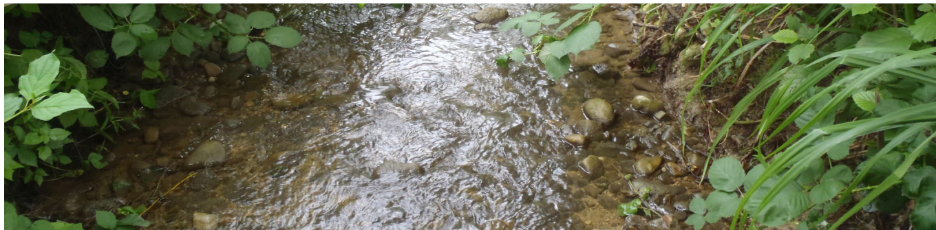
Schwärzebach kurz vor der Kantonsgrenze Thurgau