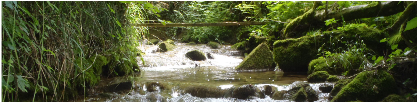
Finkenbach vor der Mündung in die Thur