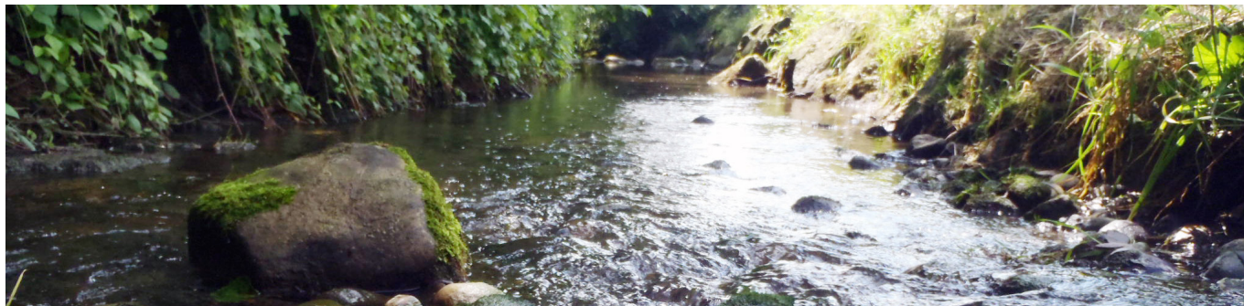
Dorfbach Andwil vor der Mündung in den Chellenbach