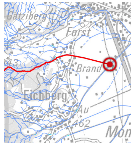
Lage des Widenbachs in Altstätten

Der Invertebratenindex IBCH beschreibt die allgemeine biologische Gewässerqualität und der SPEAR -Index die Pestizidbelastung anhand der Lebensgemeinschaften der wasserlebenden Wirbellosen.