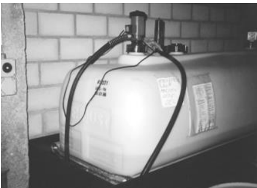
Kleintank mit elektrischer Pumpe

Die auf dem Markt erhältlichen Elektropumpen haben eine Förderleistung von 40 – 70 Litern je Minute. Solche Pumpen lassen sich direkt im Tankscheitel in die 2-Zoll-Muffe einschrauben. Der flexible Füllschlauch muss nach der Betankung innerhalb der Auffangwanne an der Pumpe montiert werden können. Selbstverständlich ist auch hier eine arretierbare und automatisch abschaltende Abfüllpistole am Leitungsende anzubringen. Andere Förderpumpen sind aus siphonieretechnischen Gründen über der Tankscheitelhöhe zu montieren und mit einer festen Leitung mit dem Tank zu verbinden. Werden Zapfsäulen eingesetzt, so ist gegen das Siphonieren ein Sicherheitsventil (z.B. Elektromagnetventil) in die Saugleitung über der Tankscheitelhöhe einzubauen.