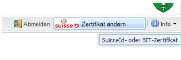
Funktion Zertifikat ändern

Nach der Anmeldung für einen OSM-Dienst unter 2) setzen Sie bitte das BIT-Zertifikat in das Kartenlesegerät ein. Anschliessend bitte die Funktion "Zertifikat ändern" wählen und den folgenden Dialog bestätigen.