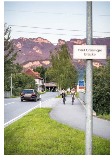
Links: Ein Schweizer und ein deutscher Grenzpolizist an der Grenze bei Diepoldsau, um 1939/40, | Rechts: Die Paul-Grüniger-Brücke zwischen Diepoldsau und Hohenems, 2021