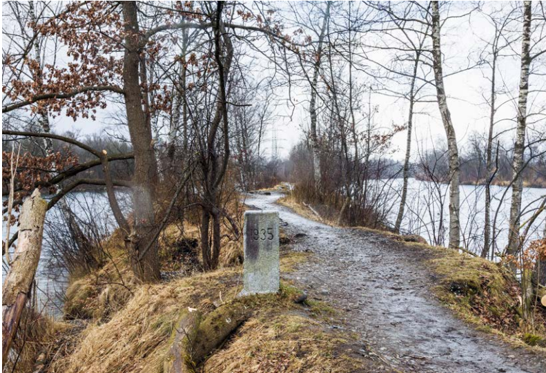
Grenzstein zwischen Österreich und der Schweiz am Mitteldamm des Alten Rheins bei Hohenems, 2021