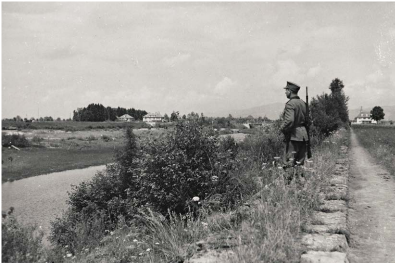
Streife beim Hohenemser Bad, August 1943