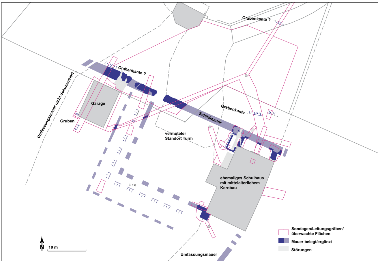
Lütisburg, Burg Lütisburg. Übersicht über die Resultate der Untersuchungen 2010-2012.