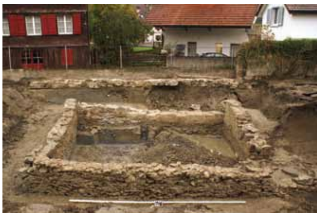
Rheineck, Im Weier. Übersicht über das freigelegte Gebäude und die Stadtmauer.

Das Areal liegt im Nordwesten des mittelalterlichen Städtchens. Ein Überbauungsprojekt bedingte Sondierungen (Leitung Steffen Knöpke). Dabei konnte der bo-