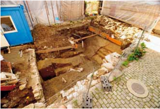
St. Gallen, Schwertgasse 15. Blick auf den ehemaligen Hinterhofbereich und den teilweise ausgenommenen Graben.