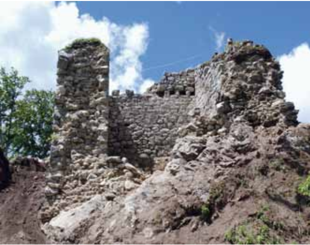
Wildhaus-Alt St. Johann, Wildenburg. Hauptturm nach der Freilegung.

haltungszustandes musste auf der Westseite eine grosse Partie des Mauermantels neu aufgeführt werden. Am Turm wurden die Konservierungsarbeiten abgeschlossen, die restlichen Arbeiten sind für das Frühjahr 2013 vorgesehen.