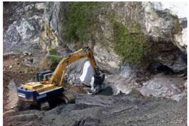
Oberriet, Unterkobel. Zuschütten der Fundstelle.

grabung wurden die Fundschichten mit Geotextil abgedeckt und zugeschüttet.