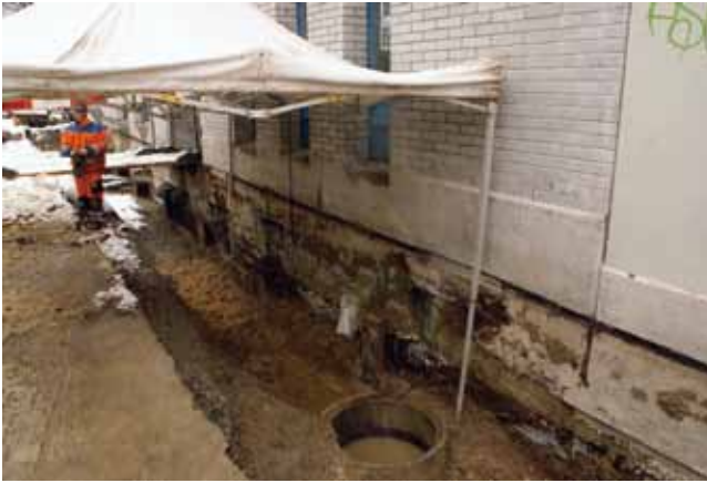
St. Gallen, Zeughausgasse, vor Haus 7. Missliche Bedingungen für die Dokumentation eines frühmittelalterlichen Grabes durch Roman Meyer.

stadt nachweisbar ist, auf Höhe des Restaurants Zeughaus endet. Von dort nach Osten erstreckt sich ein ausgedehnter Friedhof, dessen südliche Ausdehnung bereits 1998 beim Bau des Pfalzkers erfasst worden ist. Fünf Gräber wurden aufgedeckt, auf rund 20 m wurden gefleckte Auffüllungen von zahlreichen weiteren Gräbern beobachtet. Um Kosten und Zeit zu sparen, wurde nach der Entdeckung der ersten Gräber die Sohle der Gräben oberhalb der zu erwartenden Bestattungsschichten gehalten. Damit bleibt der Friedhof im Boden bewahrt. Seine nördliche Ausdehnung kann nun abgeschätzt werden. Er reicht bis zu einer quer zur heutigen Strasse laufenden, mindestens 2.4 m tiefen Senke auf Höhe der Häuser 11 und 12. Diese Senke könnte als künstlicher Ostabschluss der frühmittelalterlichen Klostersiedlung gedeutet werden. Ein Graben als Abschluss der Klostersiedlung liess sich auch in der Webergasse feststellen. Auch hier wurde er spätestens ab dem 13. Jahrhundert aufgelassen und aufgefüllt.