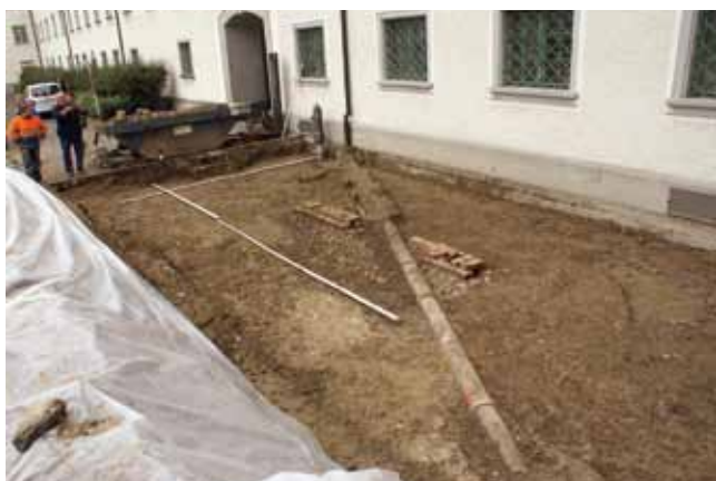
St.Gallen, Klosterhof. Direkt unter dem Humus erscheinen Wasserkanäle des 19. Jahrhunderts und die barocke Hofpflästerung.

Im Keller des Bischofsflügels ist seit 2008 das Büchermagazin der Stiftsbibliothek untergebracht. Da die Feuchtigkeit zum Dauerproblem wurde, war das Mauerwerk trocken zu legen. Eine Sickerpackung entlang des Klosterflügels bis unter das Fundament hätte eine Grossgrabung mit hohen Kosten zur Folge gehabt. Deshalb war eine Lösung mit möglichst geringen Bodeneingriffen gefordert, was auch den knappen Finanzen des Katholischen Konfessionsteils entgegen kam. Eine Kunststoffabdeckung mit Abflussrinne soll nun das Oberflächenwasser vom Gebäude ableiten. Dieses Vorgehen ermöglichte, bedeutendes archäologisches Kulturgut im Unesco-Weltkulturerbe