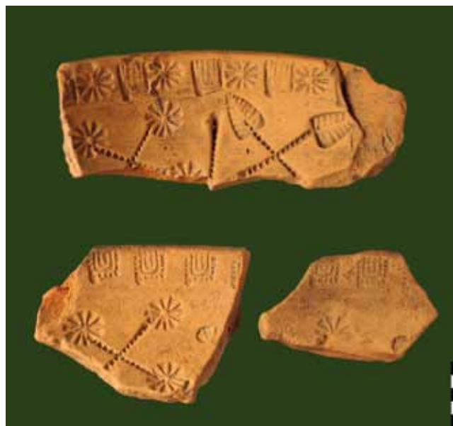
Rapperswil-Jona, Kempraten, Nuxo. Fragmente von zwei Formschüsseln zur Herstellung von Reliefsigillata. Passende Ausformungen sind noch nicht bekannt.

In der Südecke der Bauparzelle wurden im Profil der Baugrube mehrere Gruben angeschnitten. Eine davon dürfte als Töpferofen zu interpretieren sein. Im zentralen Bereich (Grabung 120 m 2 ; Leitung Pirmin Koch) fand sich ein dreiphasiger Graben, der von Osten nach Nordwesten Richtung Vicus bog. Der älteste Graben war nur schlecht erhalten, da er von den jüngeren geschnitten wurde. Der