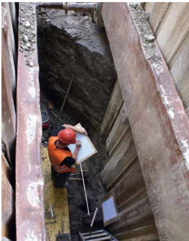
St.Gallen, Schwertgasse, vor Haus Nr. 27. Blick auf die gut erhaltene Stadtmauer und den davor liegenden Stadtgraben. Erwin Rigert beim Dokumentieren. Foto KASG.

Die erste Etappe zur Erneuerung der Werkleitungen in der nördlichen Altstadt startete in der Schwertgasse. Erstmals erfolgte eine systematische archäologische Begleitung (Leitung Erwin Rigert). Dabei konnte der Verlauf der im 15. Jahrhundert errichteten und 1809 niederge-