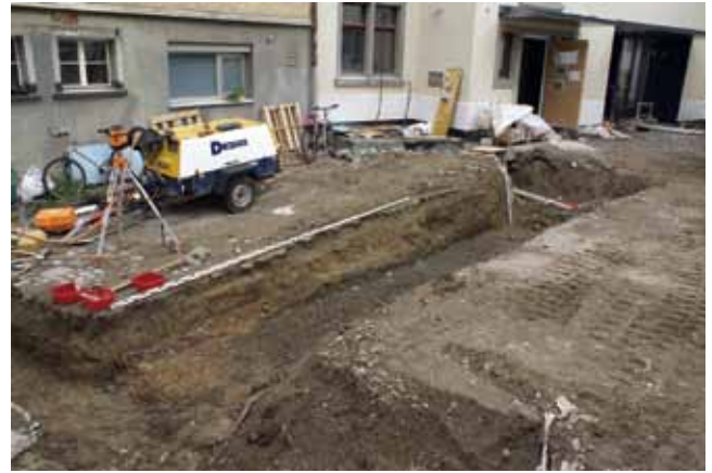
St. Gallen, St. Katharinen. Blick auf den neuen, in archäologische Schichten eingetieften Fundamentgraben. Gut sichtbar der mittelalterliche rötliche Brand- und Abbruchschutt.

sprachen verzögerte sich das Bauprojekt bis 2012. Die Kantonsarchäologie wurde erst kurz vor Baubeginn informiert, obwohl die 2008 erteilte Baubewilligung bereits auf die notwendige archäologische Untersuchung hingewiesen hatte. Die Ausgrabung, die vom 23. Juli bis 28. September dauerte, leitete Dr. Steffen Knöpke.