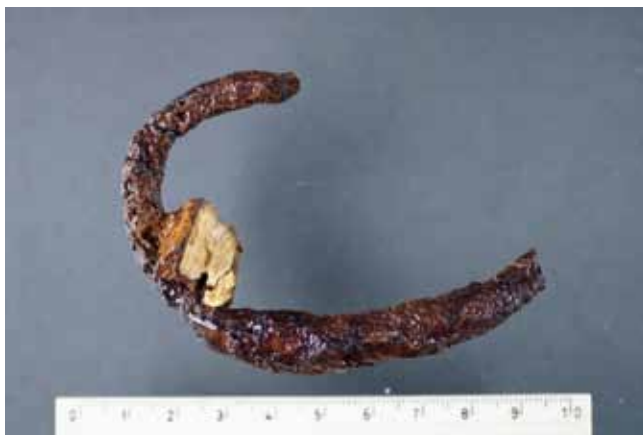
Rorschach, Raiffeisenbank, Grab 2. Eiserner Armreif des 7. Jahrhunderts mit anhaftendem Knochenfragment der rechten Elle.

machungszahlung und mehreren Strafbefehlen. In der Folge konnten diverse Baggerarbeiten auf kleineren Restflächen durch Dr. Regula Steinhauser archäologisch begleitet werden. Dies führte zur Entdeckung eines weiteren geosteten Grabes (Grab 2). Der 40–50 Jahre alte, knapp 169 cm grosse Mann trug am rechten Vorderarm einen eisernen Armreif mit verdicktem Mittelstück, der in die erste Hälfte des 7. Jahrhunderts datiert. Die frühmittelalterliche Zeitstellung der beiden Gräber wird durch C14-Daten am Skelettmaterial bestätigt (Grab 1: 8./9. Jh., Grab 2: 6./7. Jh.). Sie gehören demnach zu dem schon seit 1869 bekannten frühmittelalterlichen Friedhof rund um die im 7./8. Jahrhundert errichtete Kolumbanskirche. Bei den unbegleiteten Aushubarbeiten dürften mehrere frühmittelalterliche Gräber zerstört worden sein.