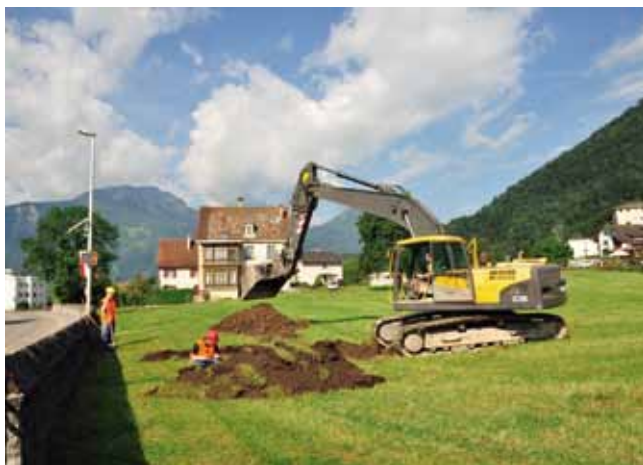
Weesen, Staad. Baggersondagen im August, Blick gegen Westen.

Die wenig überbaute Flur «Staad» liegt im Nordosten des Städtchens Alt-Weesen auf dem Schuttkegel des Spittelbachs. Eine geplante Überbauung machte archäologische Sondierungen nötig. Die Arbeiten wurden durch ProSpect GmbH als Mandat durchgeführt. Ganz im Süden des Areals liegen Reste der mittelalterlichen, 1388 zerstörten Stadt Alt-Weesen und der 3,5 m tiefe Stadtgraben, der noch bis ins 20. Jahrhundert sichtbar war. Vom nördlichen Bereich gab es dagegen keinerlei archäologische Informationen. Hier wurden in der Folge 16 Suchschnitte geöffnet. Diese wurden in den mächtigen Überdeckungen des Spittelbachs bis zu 3,5 m tief ausgehoben. Bis auf ein undatiertes Mauerfundament wurden im nördlichen Bereich keine archäologischen Strukturen gefasst. Eingela-