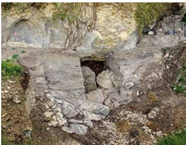
Oberriet, Unterkobel. Nach Abschluss der Grabungen im Juni 2012.

bio Wegmüller). Dadurch konnte ein repräsentativer Ausschnitt der 2011 von Spallo Kolb entdeckten Fundstelle ausgegraben und offene Fragen zur Ausdehnung der Fundschichten geklärt werden. Nach Abschluss der Aus-