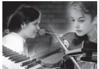
yoho Musikalisches Rahmenprogramm