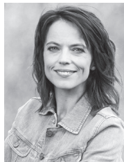
Mona Vetsch Moderation