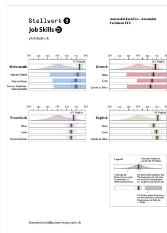
Vergleich mit Profilvorgaben eines Lehrberufs