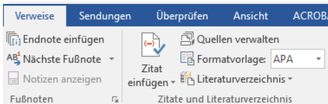
Abbildung 1 Quellenverzeichnis erstellen Schritt 1