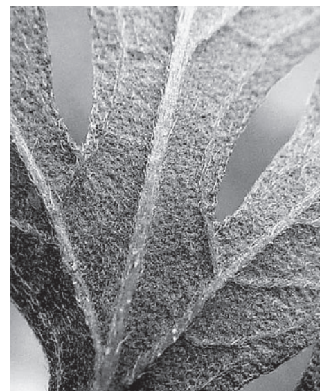
Die Blattunterseite ist schwach behaart, die Blattnerven erscheinen hell.