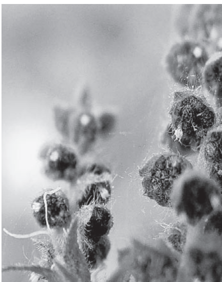
Männliche und weibliche Blüten in Nahaufnahme.