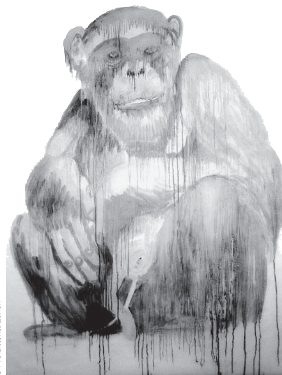
Marlies Pekarek, «Sitzender Schimppanse», Mischtechnik auf Papier, 2003, 125 x 96 cm, Kunstsammlung des Kantons St.Gallen, Inv. Nr. 6029.