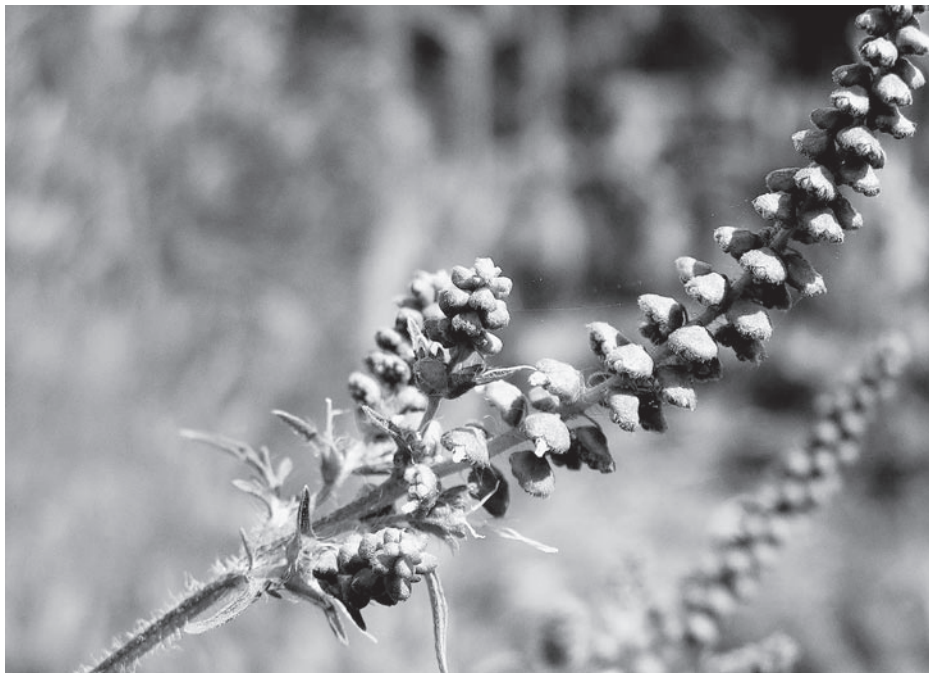
Blütenstand mit männlichen Pollentaschen. Die untersten Blütenorgane mit zwei weissen «Fäden» sind weiblich.

Beim Vorkommen von Einzelpflanzen oder kleineren Pflanzengruppen, wie dies hauptsächlich zu erwarten ist, werden die Pflanzen am besten noch vor der Blüte mit Hilfe von Gartenhandschuhen ausgerissen und kompostiert. Sollten sie jedoch bereits Blütenstände gebildet haben, wird vorsichtshalber mit einer Feinstaub-Schutzmaske gearbeitet, um eine Sensibilisierung zu vermeiden. Anschliessend sind die Pflan-