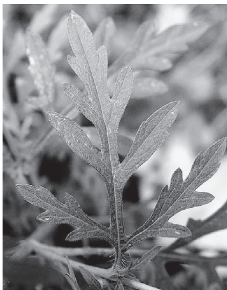
Typisches Blatt: Von der Blattrippe stehen Fiederblätter ab.