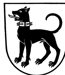
Die Dogge steht seit dem 13. Jahrhundert im Wappen der Toggenburger. Das Toggenburg benutzt dieses Wappen bis heute.