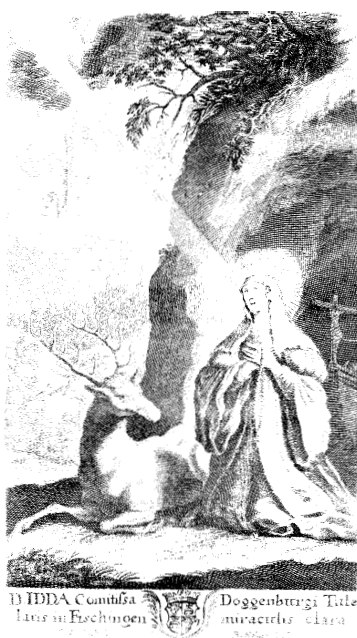
Darstellung der Iddalegende aus dem Jahre 1696. Im Vordergrund St. Idda als Einsiedlerin, im Hintergrund der Sturz aus der Burg. Der Hirsch mit den Kerzen auf dem Geweih soll der Heiligen zum Kirchgang nach Fisingen geleuchtet haben.