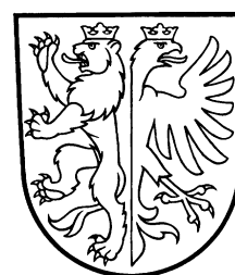
Löwe und Adler zieren das ältere Wappen der Toggenburger, das der Gemeinde Kirchberg heute als Wappen dient.