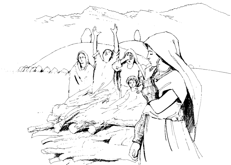
Rekonstruktion einer Bestattungsszene im 6. Jahrhundert v. Chr. auf dem Balmenrain. Im Vordergrund der Scheiterhaufen für die Totenverbrennung,

Seit der Jungsteinzeit (4. Jahrtausend v. Chr.) bestatteten die Menschen im europäischen Raum ihre Toten in Grabhügeln. Während der mittleren Bronzezeit (15.–14. Jahrhundert v. Chr.) und der älteren Eisenzeit (800–450 v. Chr.) war diese Bestattungssitte besonders verbreitet. In der darauffolgenden jüngeren Eisenzeit (450–15 v. Chr.) wurden die Verstorbenen meist unverbrannt in Flachgräbern beigesetzt. Einzelne Grabhügel sind auch aus dem frühen Mittelalter (6.–8. Jahrhundert) bekannt.