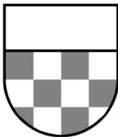
Das Wappen der Familie Giel von Glattburg und von Gielsberg war Vorbild für das Wappen der Gemeinde Flawil.