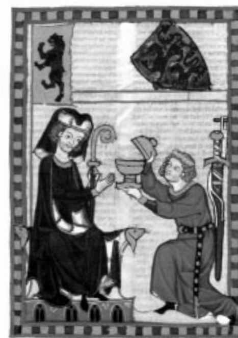
Der Minnesänger Konrad von Landegg waltet beim Abt von St. Gallen seines Amtes als Mundschenk. Bild aus der Manessischen Liederhandschrift, 1. Hälfte des 14. Jahrhunderts.