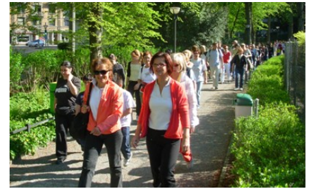
„go for 5“ am 5. Mai 2008 in St.Gallen

nehmenden über zwei Millionen Bewegungsminuten. Unter www.schweizbewegt.ch steht der Schlussbericht zur Verfügung.