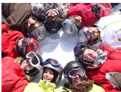
Jugendcamp 2008 in Flumserberg

Im Jahr 2008 führte das Amt für Sport vier Jugendcamps durch. Jugendliche aus verschiedenen Kantonen nutzten die Gelegenheit, sich während einer Ferienwoche unter fachkundiger Betreuung sportlich vielseitig zu bewegen.