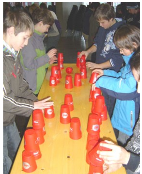
Schülerinnen und Schüler messen sich im Stacking (Becher stapeln).

das Bildungs- und das Gesundheitsdepartement des Kantons St.Gallen die Wichtigkeit einer engen Zusammenarbeit im Bereich von Prävention, Gesundheit und Bewegung.