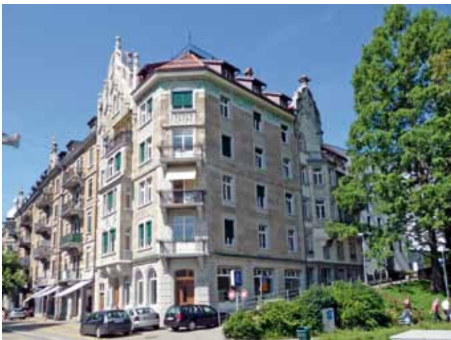
Rosenbergstrasse 42/42a aus dem Jahr 1904, St.Gallen

Die Gesamtkosten belaufen sich auf Fr. 3'001'500.–. Darin sind denkmalpflegebedingt anrechenbare Aufwendungen von Fr. 815'500.– enthalten. Bei einem Beitragssatz von 20 Prozent (lokal-regionale Bedeutung) ergibt sich eine Gesamtsubvention von Fr. 163'100.–. Davon entfallen auf den Kanton und die Stadt St.Gallen je Fr. 81'500.–. Der Staatsbeitrag beträgt Fr. 85'000.–.