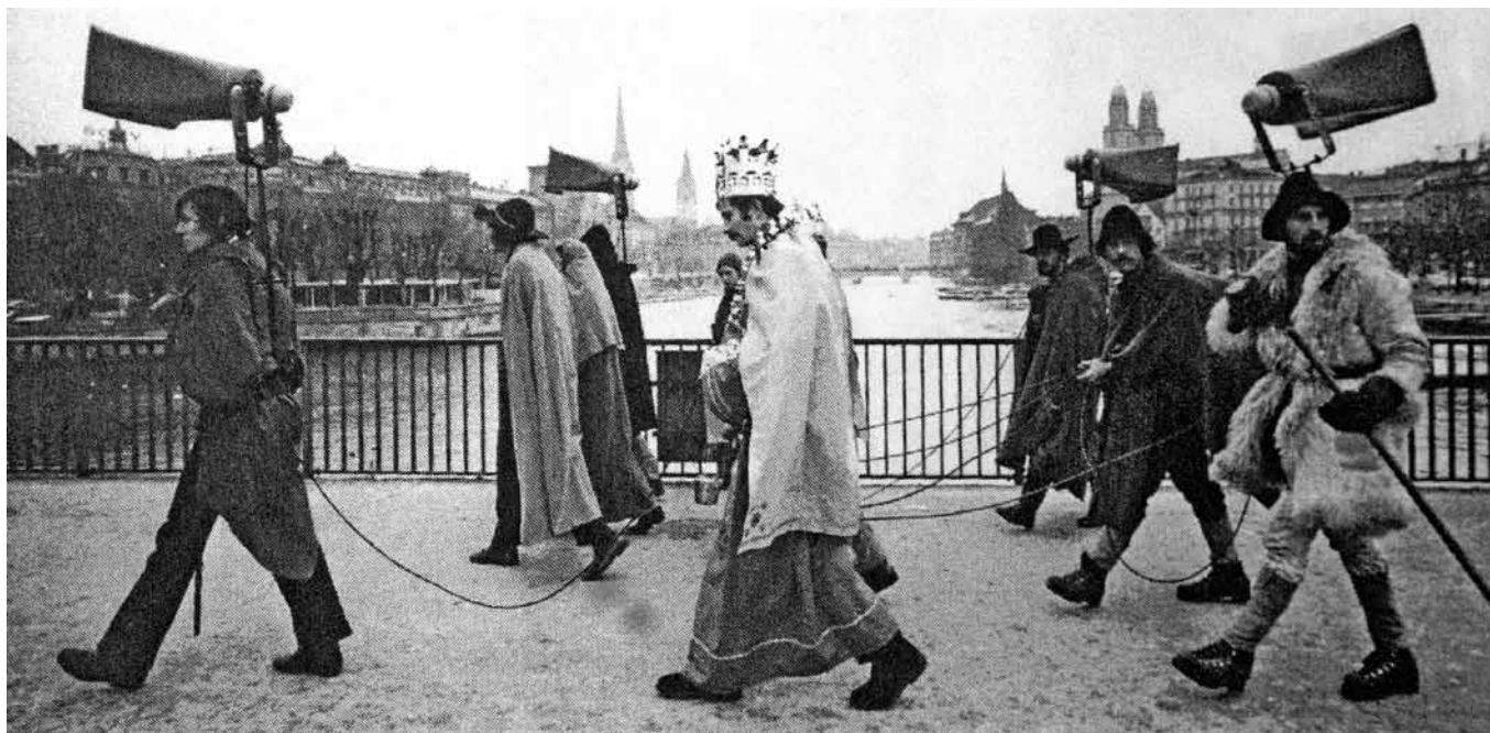
Die Sonderausstellung des Historischen und Völkerkundemuseums zeigt den vielfältigen Inhalt, insbesondere die Fotografien der Sammlung Roland Gretlers.

Der Kanton unterstützt das Historische und Völkerkundemuseum daher ausnahmsweise mit Fr. 20'000.–. Weitere Beiträge in der Höhe von Fr. 55'000.– müssen durch Stiftungen und Eigenleistungen eingebracht werden.