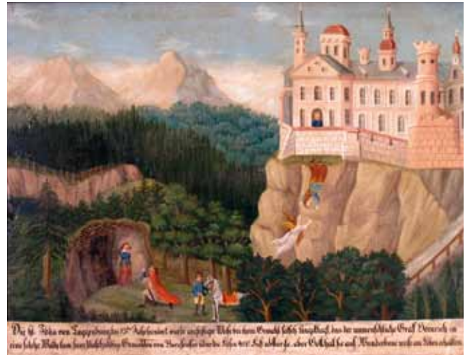
Die legendäre Lebensgeschichte der Idda ist auf diesem Ölgemälde als Bildergeschichte dargestellt. Es hängt im Toggenburger Museum in Lichtensteig.

Im Juli und August 2011 realisiert die Freilichtbühne Thurtal, die aus dem Zusammenschluss der renommierten Lientheater Freilichtbühne Wil und Theater Lenggenwil entstanden ist, erstmals eine Freilichtaufführung. Die Geschichte der historischen Figur Idda von Toggenburg wird auf der Weierwiese zur Auffüh-