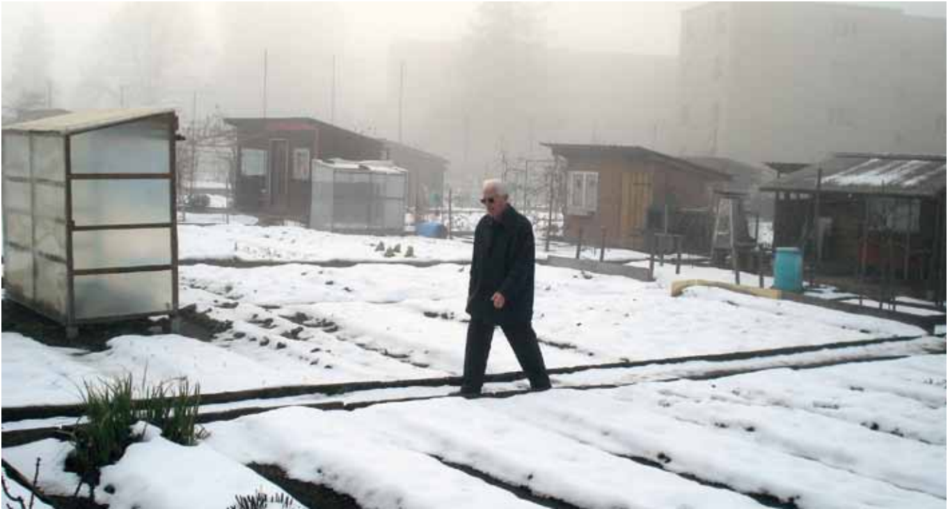
«Vaters Garten» im Winter

den vom Kleinen, dem individuellen Familien-«Theater», zum Grossen, den typischen Verhaltensweisen unserer Gesellschaft. Ohne die Kenntnis unserer persönlichen Hintergründe, unserer Eigenheiten, werden wir als Gesellschaft keine eigene Identität entwickeln, die mehr bedeutet als leerer Nationalismus. Es muss uns daran gelegen sein, unsere Wurzeln zu kennen. Ein Bruch mit der Kindheit, ein Löschen der persönlichen Hintergründe macht uns zu Entwurzelten.