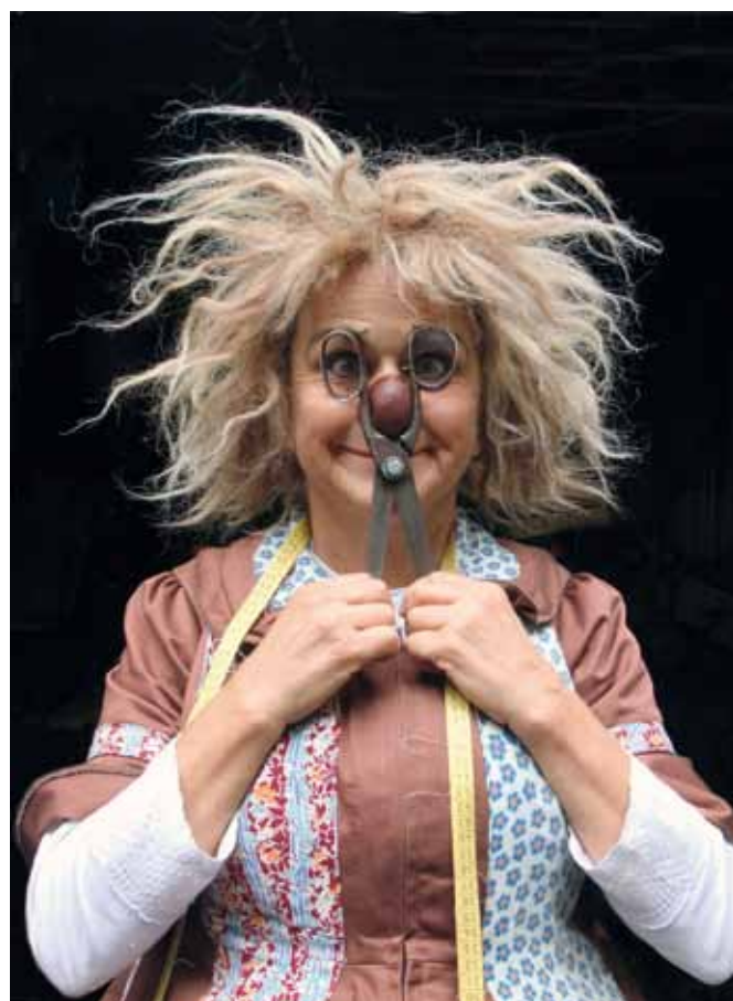
Kuno Bonts Dokumentarfilm über Gardi Hutter entsteht während der Erarbeitung ihrer neuen Produktion «Die Schneiderin».

Der Film wird in digitaler Form realisiert. Geplant ist eine Auswertung in Arthouse-Kinos und die Teilnahme an Filmfestivals. Aufgrund der sehr hohen Einschaltquoten von 21 Prozent bei der Fernsehausstrahlung von «Königstreffen», was einer realen Zuschauerzahl von 192'800 Personen entspricht, wird erneut eine Koproduktion mit dem Schweizer Fernsehen, in einer gekürzten Version des Filmes, als zusätzliche Option verfolgt. Die Kosten für den geplanten Film belaufen sich gemäss Budget auf Fr. 350'145.–. Das Patronat für den Film übernimmt die Stadt Altstätten; sie beteiligt sich mit Fr. 40'000.– an der Produktion und mit zusätzlichen Fr. 10'000.– am Premierenanlass in Altstätten. Neben einem Eigenfinanzierungsanteil von Fr. 70'000.– ist ein Beitrag von Fr. 18'000.– der Rheintaler Kulturstiftung zugesichert. Vorgesehen sind zudem Beiträge des Kantons Tessin von Fr. 15'000.–, Fr. 125'000.– von Stiftungen und ein Herstellungsbeitrag von Fr. 65'000.– des Bundesamtes für Kultur, Sektion Film. Ein Koproduktionsbeitrag des Schweizer Fernsehens in der Höhe von Fr. 40'000.– wird nach dem Rohschnitt beantragt. Der Kanton beteiligt sich mit Fr. 40'000.– am Projekt.