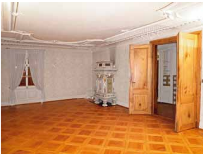
Salon im Erdgeschoss des Hauses Museumstrasse 1, St.Gallen

Die geplante Renovation respektiert die räumlichen Vorgaben. Im Weiteren ist vorgesehen, die historischen Räume wieder in ihrer originalen materiellen und farblichen Vielfalt zu restaurieren und, wo notwendig, wiederherzustellen. Neu soll das klassizistische Gebäude als repräsentativer Verwaltungssitz einer Bank dienen. Die Gesamtkosten belaufen sich auf Fr. 4'373'000.–. Darin sind denkmalpflegebedingt anrechenbare Aufwendungen von Fr. 652'000.– enthalten. Bei einem Beitragssatz von 25 Prozent (regionale Bedeutung) ergibt sich eine Gesamtsubvention von Fr. 163'000.–. Davon entfallen auf den Kanton und die Stadt St.Gallen je Fr. 81'500.–. Der Staatsbeitrag beträgt Fr. 85'000.–.