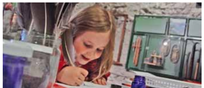
Am Internationalen Museumstag 2010 fand in allen vier beteiligten Museen die erfolgreiche Buchvernissage des «Südkultur»-Museumsführers «Ab ins Museum!» statt.

Die Kosten für die Lancierung des Kulturpasses und die Fortführung der «museumsgeschichte(n)» belaufen sich auf insgesamt rund 75'000 Franken. Sie setzen sich zusammen aus Ausgaben für den Personalaufwand für Organisation, Koordination und Durchführung der Kurse sowie Logistik-, Material-, Marketings- und Kommunikationskosten. Die Erträge aus den Kursgeldern sowie die Sponsoringbeiträge werden mit rund Fr. 15'000.– budgetiert. Südkultur leistet einen Beitrag von Fr. 30'000.–. Der Kanton beteiligt sich am regionalen Kulturvermittlungspilotprojekt mit einem Beitrag in derselben Höhe von Fr. 30'000.–.