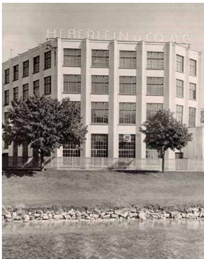
Haus Casablanca aus dem Jahr 1926, Westfassade, Wattwil

aus einer grossen Halle und einem 4 stöckigen Fabrikationsgebäude. Es wurde 1926 von den Architekten von Balmer und Ziegler erbaut und erhielt aufgrund seiner kompakten, modernen Erscheinung und dem weissen Anstrich schon bald den Übernahmen «Casablanca». Der Hochhausteil dieses in reiner Betonkonstruktion erstellten Gebäudes wird nun im Erdgeschoss einer gemischten Nutzung und in den darüber liegenden Etagen einer neuen Wohnnutzung zugeführt, wofür es umfassend renoviert, auf der Südseite mit Balkonen, auf dem Dach mit einer modernen Attika und innen mit einer neuen Erschliessung versehen wird. Das sorgfältig erarbeitete Projekt respektiert die statische Grundstruktur des Gebäudes und bewahrt seinen Charakter. Das Gebäudeäussere wird nach denkmalpflegerischen Gesichtspunkten restauriert, das Innere für die neue Nutzung vollständig erneuert. Der Denkmalpflegebeitrag ermöglicht einen Teil der erforderlichen Betonsanierungen, den Ersatz und die Gestaltung der für das Haus so typischen Fensterpartien sowie den Fassadenputz und die äusseren Malerarbeiten.