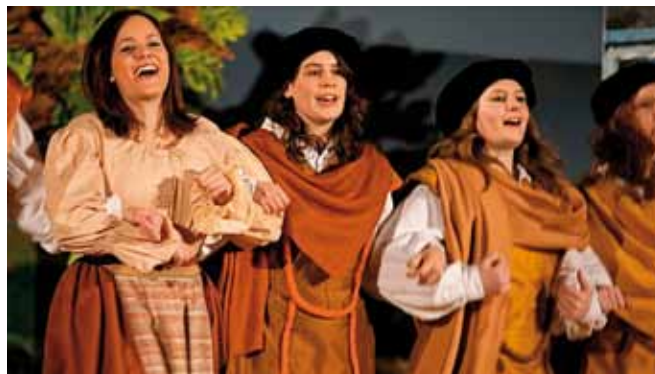
Die Musikproduktionen der Kantonsschule Sargans haben einen guten Ruf. Hier ein Eindruck der Aufführung «Boccaccio» von 2008.

Die Projekte der Kantonsschule Sargans im Bereich der klassischen Musik haben einen ausgezeichneten Ruf, in der Bevölkerung, bei Eltern und in der Schülerschaft. Das neueste Projekt, die Komische Oper «Zar und Zimmermann», schliesst an die vorangegangenen Erfolge an. Schülerinnen und Schüler, Lehrpersonen und beigezogene Fachpersonen wirken zusammen als Sängerinnen und Sänger, Orchester, als Bühnenbildende und Kostümierende, bei der Einarbeitung und Leitung. Angesprochen werden sollen vor allem Jugendliche mit Interesse für klassische Musik, aber auch solche, bei denen ein entsprechendes Interesse geweckt werden