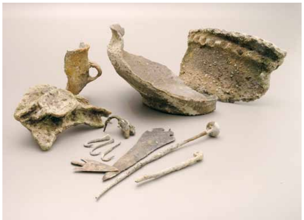
Auswahl an frühbronzezeitlichem Fundmaterial aus der Siedlung Rapperswil-Jona, Technikum

Seit 1998 laufende archäologische Tauchuntersuchungen in Zürich- und Obersee im Bereich des Seedamms (Kantone St.Gallen, Schwyz und Zürich) haben eine bis dahin praktisch unbekannte urgeschichtliche Siedlungsregion erschlossen. Als Besonderheit präsentieren sich die Überreste aus der Bronzezeit (1650-1200 v.Chr.): Ein mehrfach erneuerter Holzsteg führte von der Hurdener Halbinsel nach Rapperswil hinüber – gut 3500 Jahre vor dem heutigen Holzsteg! Die ganze Anlage mit ihrer teilweise guten Erhaltung und die Funde, welche wohl ehemals als Opfergaben ins Wasser gelangten, weisen der Fundstelle hohe Bedeutung über die Landesgrenzen hinaus zu. Auf der Rapperswiler Seite, wohl unweit des Stegendes, lag gleichzeitig auf einer exponierten Untiefe eine Siedlung. Mit ihren rund 3'000-4'000 m 2 Fläche gehört sie zu den grossen frühbronzezeitlichen Siedlungsplätzen des nördlichen Alpenvorlandes. Es gibt in Europa keinen weiteren Fall, wo bronzezeitliche Verkehrswege und Opferplätze mit einer gleichzeitigen Siedlung in dieser Erhaltung zusammen vorliegen. Tauchuntersuchungen in den Jahren 1999, 2006 und 2008 haben Informationen zu Ausdehnung und Datierung gegeben. Die mit einer mehrfachen Palisade befestigte Siedlung mass etwa 100 m im Durchmesser. Die Siedlung wurde in der zweiten Hälfte des 17. Jahrhunderts v.Chr. gegründet und bestand wohl mehrere Jahrzehnte. Die ausserordentlichen Funde zeigen, dass