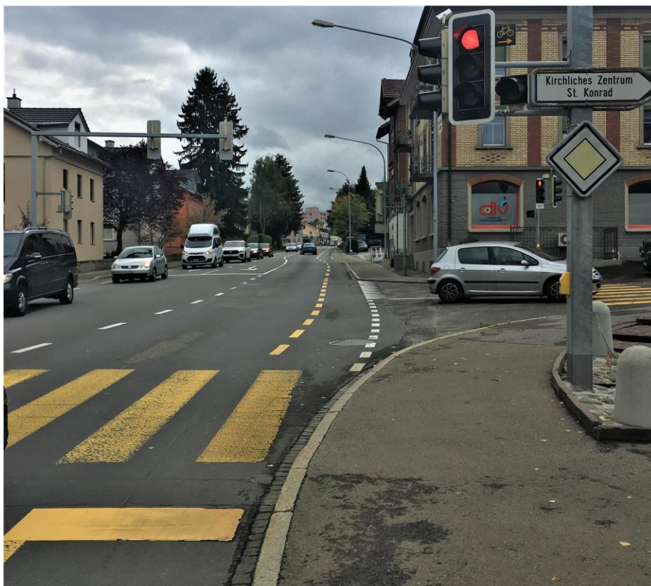
Foto: Kreuzung mit Signalisation Rechtsabbiegen bei Rot im Kanton SG

Die Einführung der neuen Regelung ist ein weiterer Schritt zur Förderung des Veloverkehrs. Dadurch können der Komfort für die Velofahrerinnen und Velofahrer weiter erhöht sowie die Stopp und die damit verbundenen Wartezeiten minimiert werden.